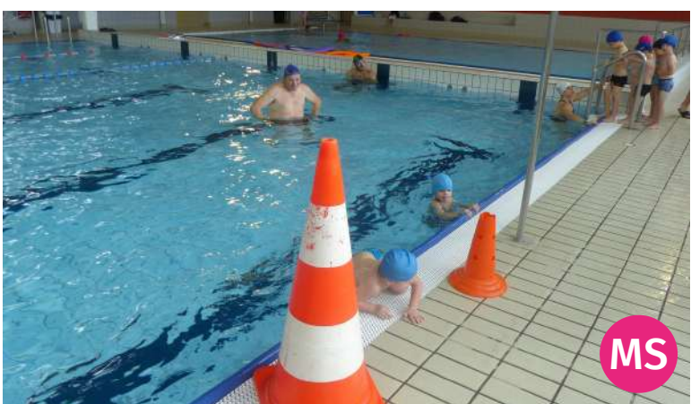
Nager sur le ventre/dos avec les frites. Découvrir l'espace dans lequel ils évoluent pour passer dans le grand bassin.